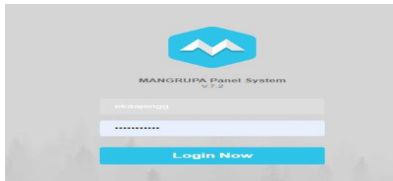
Gambar 4.1 Login Akun Pada SIA

Sesuai dengan teori Haryadi (2020), keamanan sistem informasi akuntansi merupakan aspek yang krusial dalam menjaga integritas dan kerahasiaan data transaksi. Dalam konteks ini, PT Geoff Maksimal Jaya telah mengimplementasikan protokol keamanan yang ketat untuk melindungi data penerimaan kas mereka. Berikut salah satu bukti keamanan pada SIA PT Geoff Maksimal Jaya :